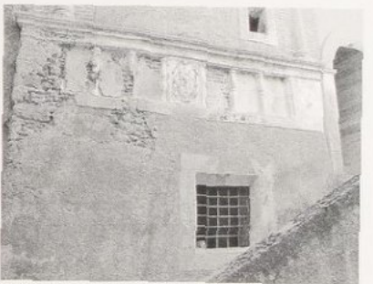
Castrovillari, Palazzo Salituri alla Giudeca (già Musitano), sec. XVII.